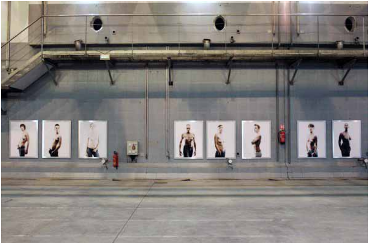
Festival Images Singulières Exposition réalisée Chais Skalli, Sète (34), du 13 au 30 mai 2010.