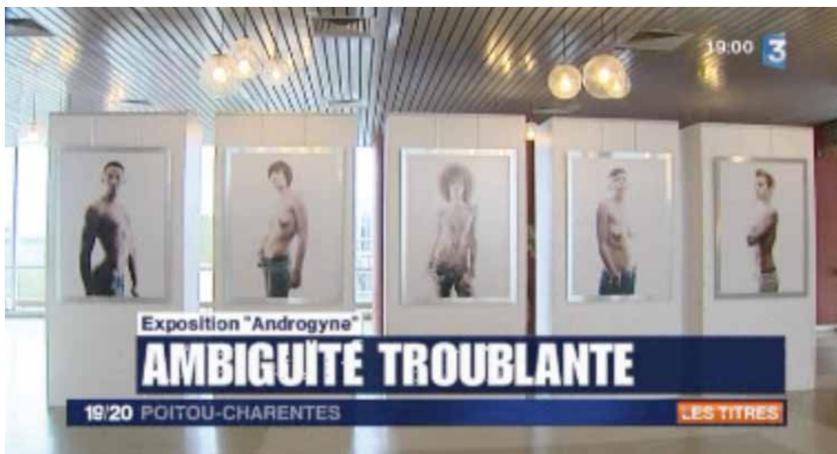
Reportage France 3 Poitou-Charentes sur l'exposition Androgyne au Palais des Congrès de Royan, août 2011. Diffusé dans le 19/20, 13 août 2011 et le 12/13, 14 août 2011