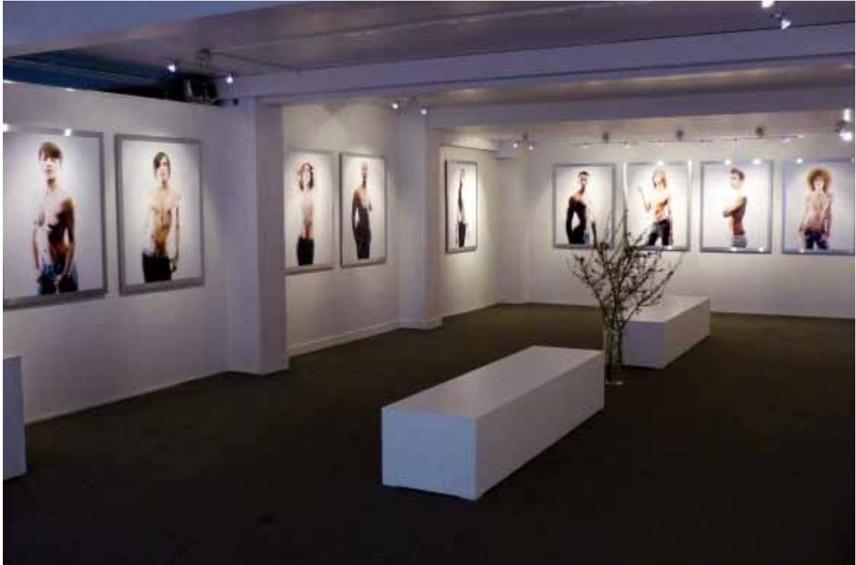
Exposition réalisée à l'Espace Dupon, Paris (75), du 6 avril au 5 juin 2009